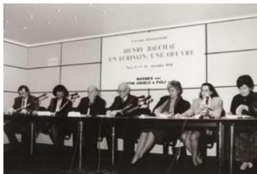
Colloque international Henry Bauchau. Un écrivain, une œuvre. Noci, Italie, 1991.

Italiques, etc.). Cette formule correspond à leur vocation : celle d'une réinvention permanente liée à l'évolution de la recherche comme aux formes d'extension du réseau.