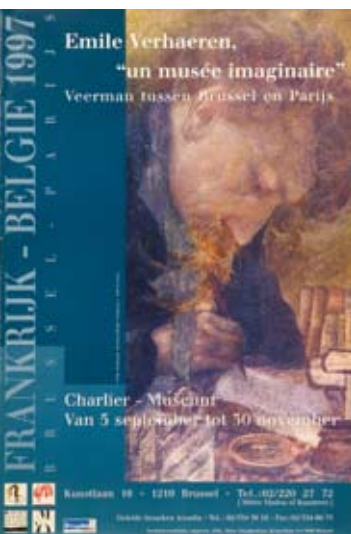
Pendant néerlandophone de l'affiche de l'exposition Emile Verhaeren, un musée imaginaire , Bruxelles, 1997.