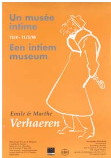
Affiche bilingue pour l'exposition "Émile et Marthe Verhaeren, un musée intime", Bruxelles, 1996.