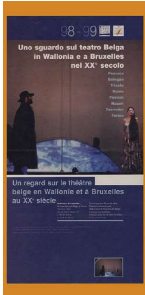
Affiche de circulation en Italie de l'exposition Un regard sur le théâtre belge en Wallonie et à Bruxelles au XX e siècle, 1998-1999.