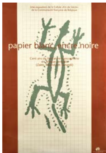
Affiche de l'exposition Papier blanc, Encre noire , Kinshasa, 1995.