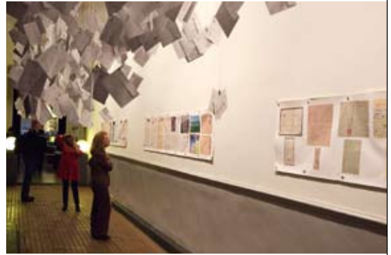
Inauguration de l'exposition Les Enveloppes du désir , à Passa Porta, Bruxelles, 2008.